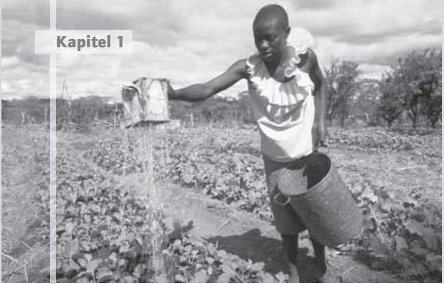
Eine Frau in Simbabwe wässert ihr Kohlfeld.