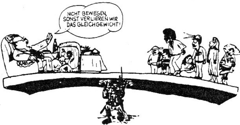
Abb. 3: Das fragile Gleichgewicht der Welt

In der Krisenentwicklung insgesamt sind zwei Dinge besonders gravierend: