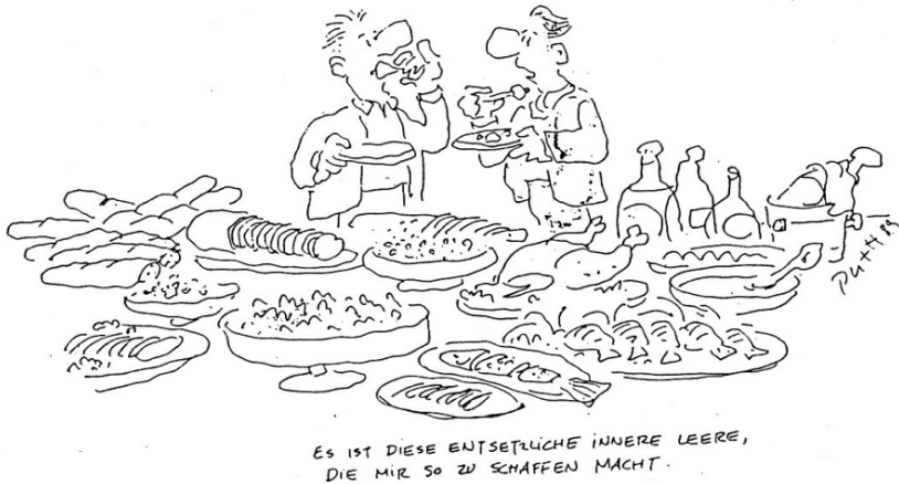
Abb. 4: Die Leere in der Fülle

Die Weisheiten der Menschheit, die Bibel, die Religionen und Philosophien haben stets gewusst, dass dies eine zerstörerische Verkennung des Lebens ist. Und es war eine ihrer größten ethischen Herausforderungen und Anstrengungen, diesem Irrtum immer wieder entgegenzutreten.