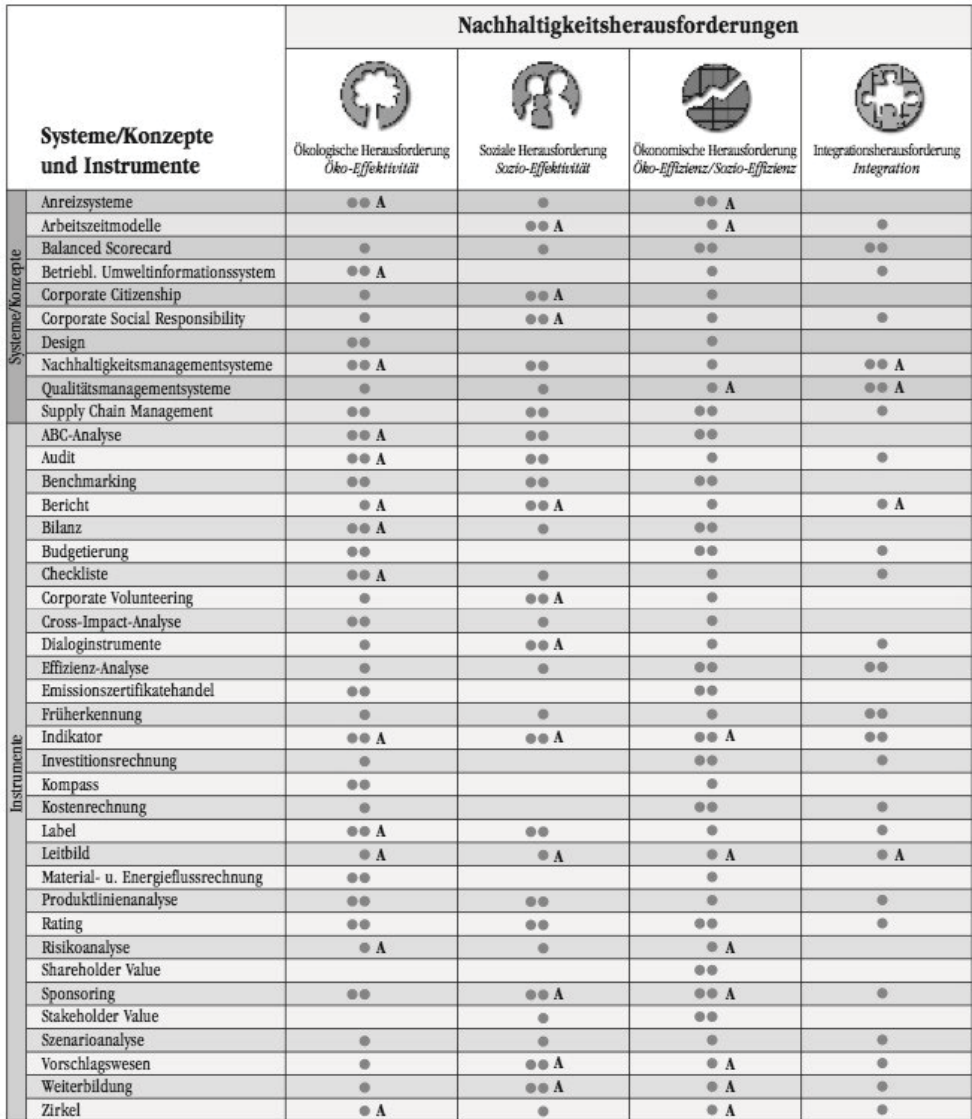
Tabelle 1: Systeme, Konzepte und Instrumente zur Begegnung der vier Nachhaltigkeitsherausforderungen